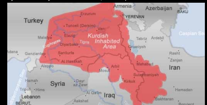
MAP: copyright KHRP, map designed by Mark Ellison IMAGE: Photo taken by Rosy Rouleau

Piraniya Kurdan Musulmanên Sunnî ne û endamê mezheba Şafîî ne. Her weha Kurdên Shiî hene ku piranî li parêzgehên Îlam û Kirmanşanê ya bi ser Îranê û li naverast û Rojhilata Îraqê (Kurdên Feylî) dijîn. Kurdên Elewî jî piranî li Tirkîyeyê dijîn. Kurdên din jî bawermendên Êzdî, Ehlê Heq û mesîhî û cihû ne.